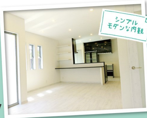
シンプルモダンな内観

20畳もある広々LDK 土間4区画を含め 1世の4区画もたっぷり ペットくぐり戸 お洒落的な家事導線