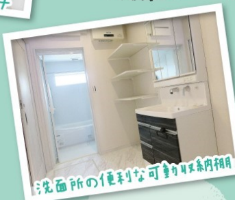
洗面所の便利なお洒落4区画内納

ご来場された方には テクノストラクチャー テクニカルカタログ & クオカード 500円分 プレゼント!!