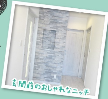
玄関前のおしゃれなニッチ

20畳もある広々LDK 土間4区画を含め 1世の4区画もたっぷり ペットくぐり戸 お洒落的な家事導線